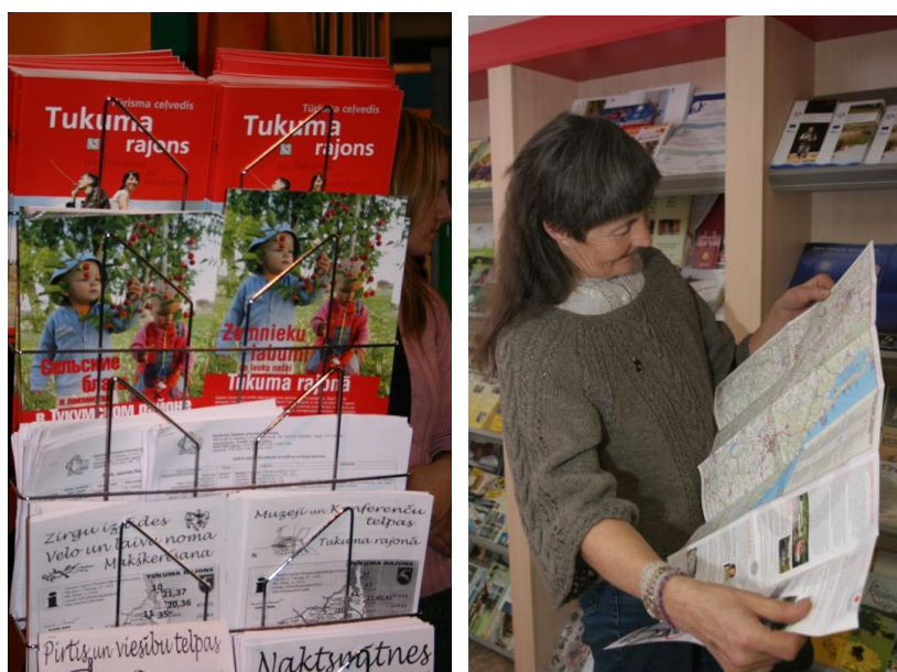
TIC apkopotā un izdotā informācija par tūrisma un atpūtas iespējām Tukuma rajonā

TICā atrodama arī tūrisma informācija arī par citām valstīm, jo TIC apmeklētāju uzskats ir, ka tūrisma informācijas centrā var noskaidrot jebkuru viņu interesējošo jautājumu par tūrismu un ceļošanu.