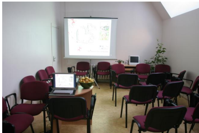
Tukuma TIC telpas Tukumā, Talsu ielā 5.